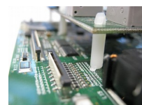
Cartes de télé-relèves