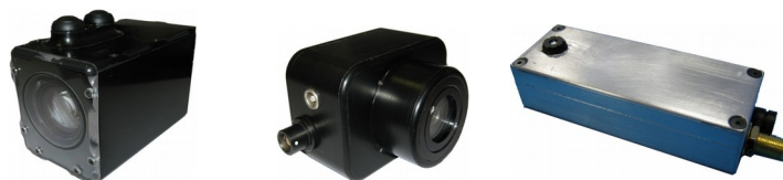
Caméras spécifiques (IR, Low lux, autonome)